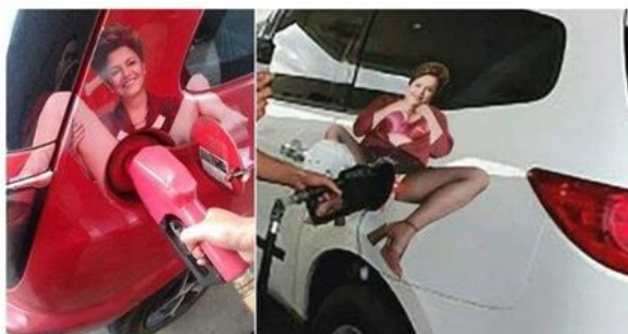
Figura 4 – Meme retirado de página antifeminista na rede social Twitter