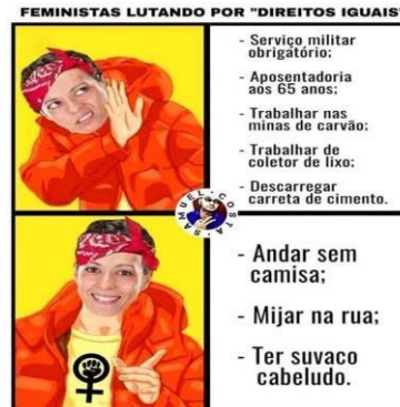
Figura 1 – Meme retirado de página antifeminista na rede social Twitter