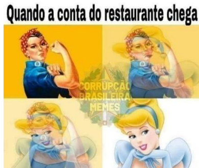
Figura 2 – Meme retirado de página antifeminista na rede social Twitter