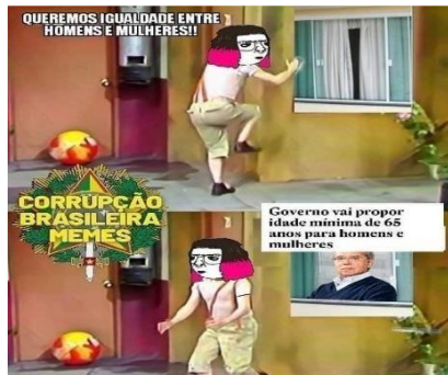
Figura 3 – Meme retirado de página antifeminista na rede social Twitter