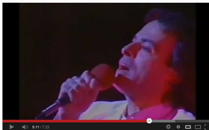
Imagem do vídeo do YouTube

Música: Seleção de canções de Villa-Lobos , Villa-Lobos