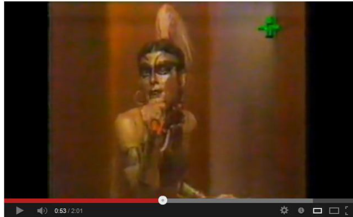
Imagem do vídeo do YouTube

Música: Sangue Latino , João Ricardo e Paulinho Mendonça (versão em espanhol)