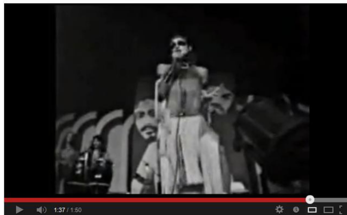
Imagem do vídeo do YouTube