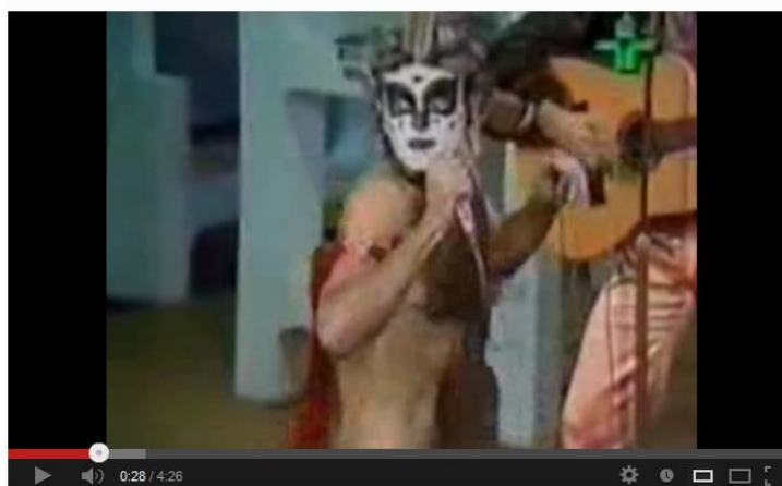
Imagem do vídeo do YouTube