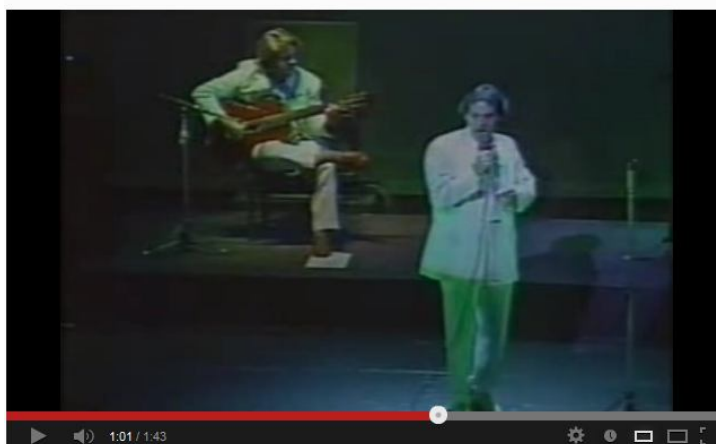
Imagem do vídeo do YouTube