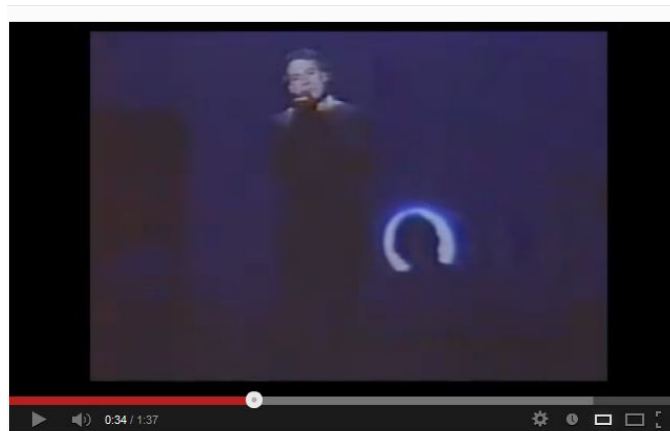
Imagem do vídeo do YouTube