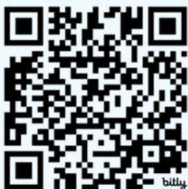
Currículo Lattes do autor