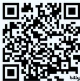
Perfil no LinkedIn do autor