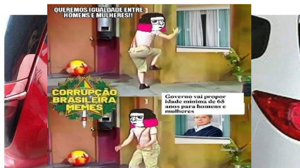
Figura 4 – Meme retirado de página antifeminista na rede social Twitter